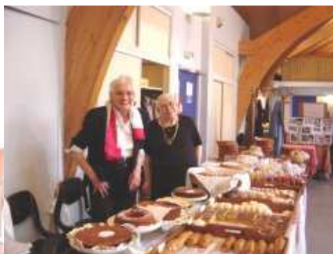
La vente des gâteaux