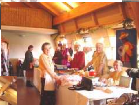
La ruche, les fleurs