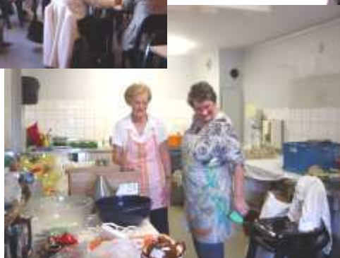
Sans oublier les cuisinières pour le repas du soir