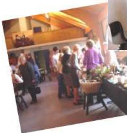
Brocante, vente de livres ou de vaisselle...