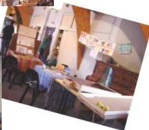
Les scouts et les jeux pour les plus jeunes