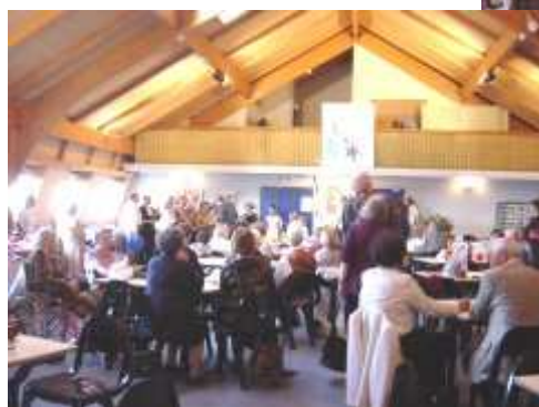
Le salon de thé et la chorale pour nous divertir