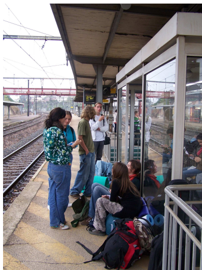
Le voyage s'est déroulé en train