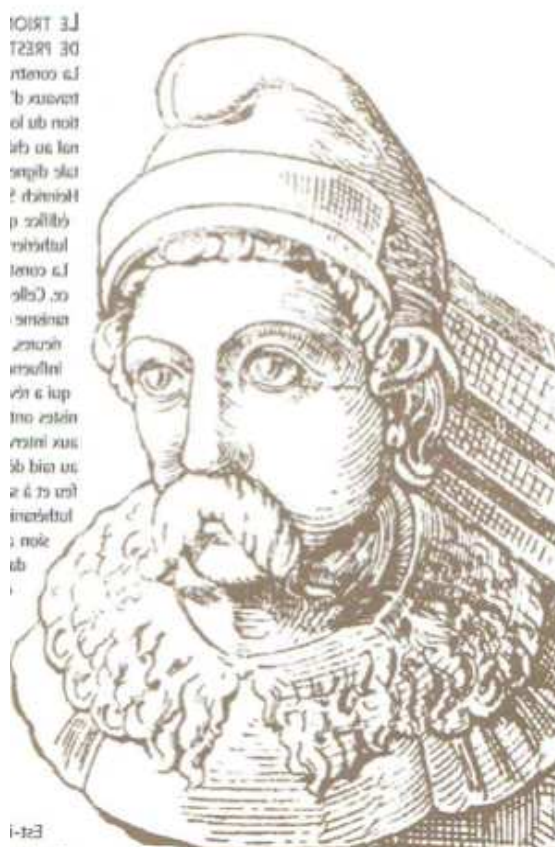
Un portrait d'Heinrich Schickhardt ?