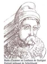
Buste d'homme au Louvre de Stuttgart Portrait gravé de Schickhardt

Au-delà des siècles, la Réforme à Montbéliard a renoué, par-dessus le Moyen-Âge, avec l'Église primitive.