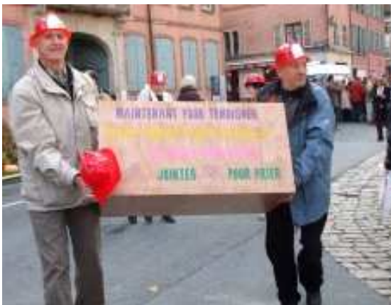
Les « maçons » de la paroisse du Val d'Allan