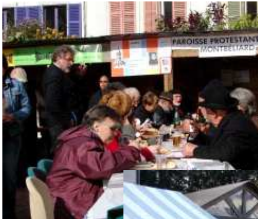
Repas au square Parrot-Sponeck