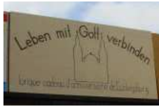
La brique de l'Église de Ludwigsburg