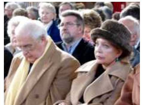
Ouverture officielle, les personnalités : Le Duc et la Duchesse du Wurtemberg