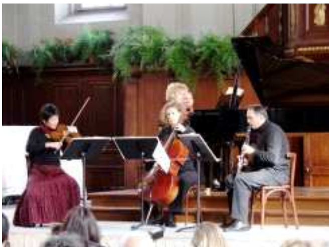
Quatuor « la fin du temps » de Messiaen par l'ENM