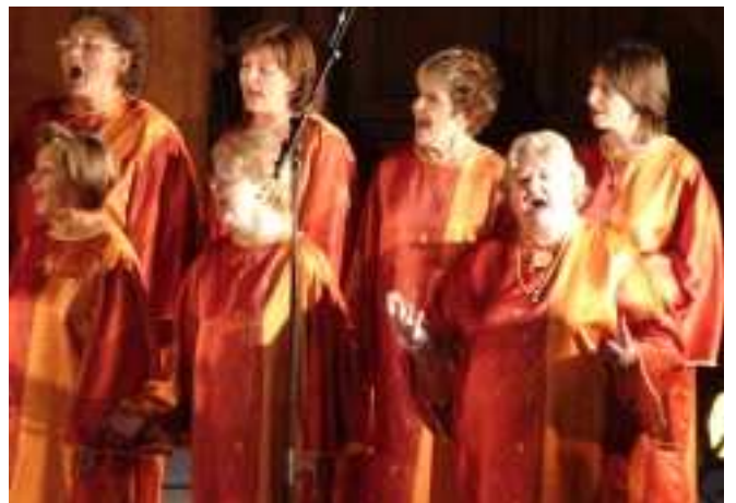
Concert gospel : Glorius Gospel Singers