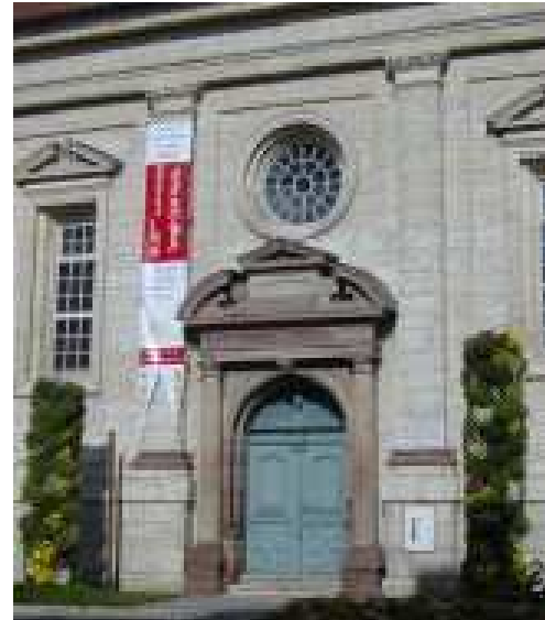
Manteau d'automne pour Saint-Martin, grâce au service Espaces Verts de Ludwigsburg