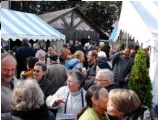
Le village des associations