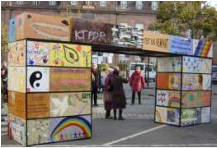
La porte de la fraternité achevée