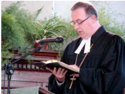
L'évêque July du Wurtemberg