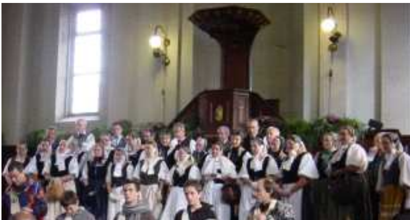
Ouverture officielle: Le Diari chante le Cry Des jeunes percussionnistes participent également