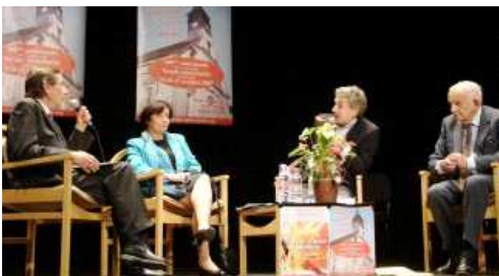
Forum « convictions particulières et fraternité républicaine