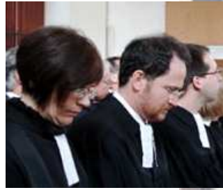
Culte à Saint-Martin Les pasteurs du lieu