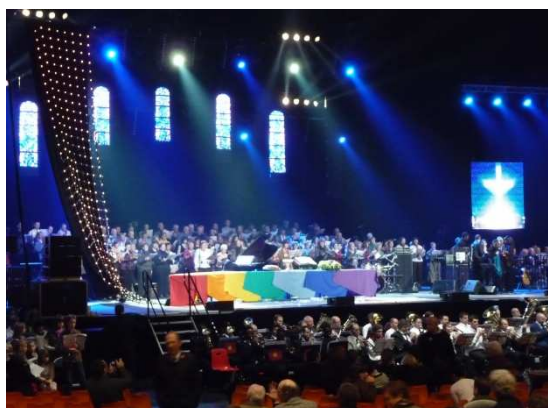
Culte au Zénith