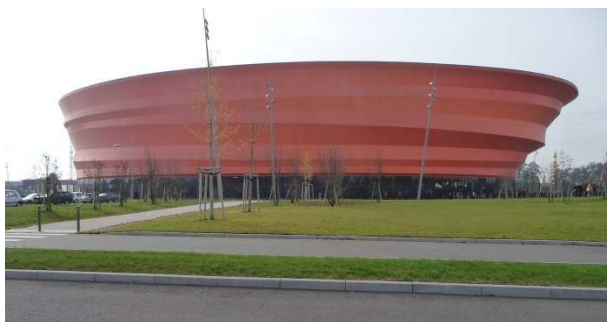
Zénith de Strasbourg

chaque paroisse était invitée à envoyer un rectangle brodé représentant sa ville : les dames de la Ruche ont confectionné cette magnifique broderie visible à l'église Saint Thomas. Nous leur adressons tous nos remerciements