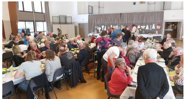
Repas du 6 avril à Sainte-Suzanne

EHPAD de Bavans : dates encore non définies par la direction de l'établissement.